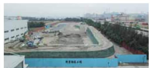
教育園區工程

盟鑫公司已跳脫生產工廠之角色，定位為綠色產業之整合應用服務，堅持根留台灣從事永續綠色工程之材料研發及相關實務整合工作，以 ACE 自有品牌經營行銷世界，並建立全球綠色防災系統整合服務平台，期望 2020 年成為世界第一之綠色專業廠商，使人類與地球得以永續發展。