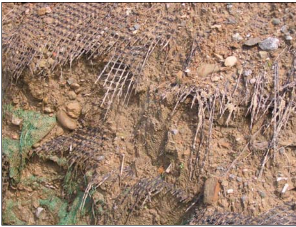
照片 5 加勁格網縱向斷裂