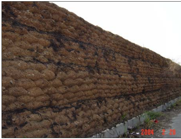
照片 10 表面焚毀