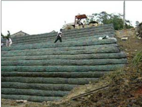
照片 1 牆面側向鼓脹

大之側土壓力所致。調查統計結果顯示此種破壞現象之發生率高達 78.95%，代表國內加勁擋土結構之設計及施工水準亟須改善。