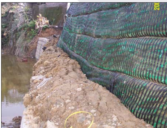
照片 7 地基承載破壞

加勁擋土結構為柔性結構，可容許較大變形，然而若其地基剪力強度嚴重不足，則在結構體載重作用下會發生承載力破壞，導致加勁擋土結構之整體破壞(照片 7)。此種破壞多發生於包含軟弱地層之不良地質構造，顯示工程之規劃與調查未盡週延，以致未能於設計時適時提出對策。本研究調查之案例中，此種破壞之發生率高達 63.16%，顯示國人忽視規劃與調查之陋習相當嚴重。