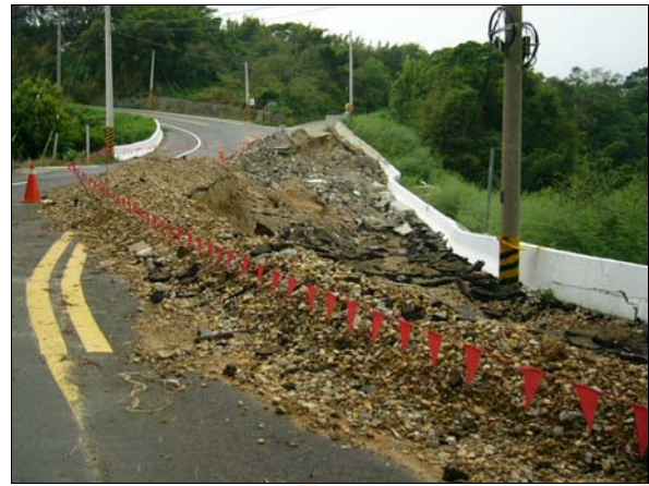
照片 3 牆頂沈陷開裂

加勁擋土結構產生之沈陷包括加勁土體本身之變形、側向位移導致之牆頂局部或全部沈陷、地基承受載重而產生之不均勻沈陷、以及地基承载力不足或整體滑動而引致之沈陷(照片 3)，其中論規模與結構整體危害性則以後二者較為嚴重。致災主要原因為規劃調查不當、分析設計錯誤，以及施工壓實度控制不良(馮光樂等人，2001)。於本研究中，此種破壞之發生率高達 63.16%，且多屬危害程度較高之整體滑動沈陷，顯示國人加勁擋土結構之工程實踐確具有嚴重疏失。