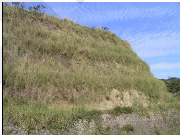
照片 9 表面局部沖蝕流失