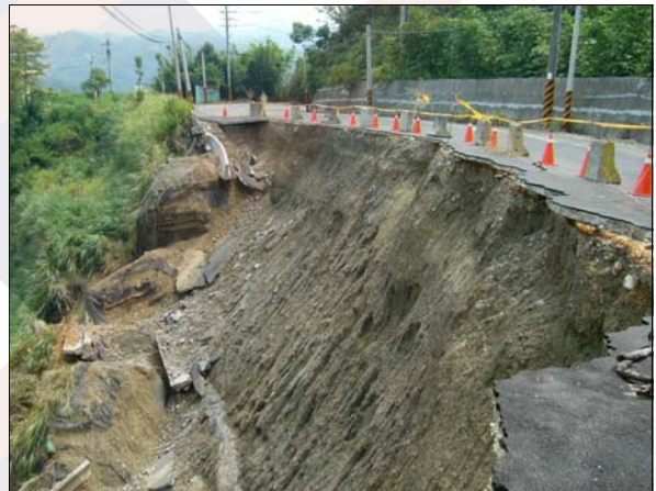
照片 8 全面坍塌破壞

加勁擋土結構表面若植生不良，導致覆蓋率不足即可能產生此種缺失(照片 9)。植物根系對加勁擋土結構之整體穩定性雖無明顯助益，惟其具有防止紫外線照射、減少雨水入滲與沖蝕，以及提昇景觀綠化效果，故就長期安全而言，仍應避免此種缺失之存在。調查統計結果顯示此種破壞現象之甚為輕微，代表國內加勁擋土結構主要使用之植生回包式面牆，在此種缺失之防止方面表現良好。