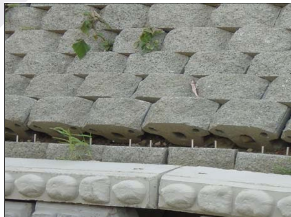
照片 4 牆面接點破壞

加勁格網之拉斷破壞係由於側土壓力過大、加勁材抗拉強度不足所致。一般而言，此種破壞多發生於加勁擋土結構之縱向即最大主應力方向(照片 5)。然而本研究觀察所及之現象卻多為伴隨側向變形、沈陷或滑動所產生之格網橫向肋條斷裂(照片 6)，且此種破壞之發生率達 42.11%，顯示國內加勁擋土結構之分析與設計應針對此種破壞模式儘速提出對策。此外，加勁格網亦應避免使用玻璃纖維等脆性材質製造者，從材質之延展性切入，防止此種破壞之發生。周南山(2000)認為此種破壞之產生原因可能為加勁擋土結構承受側向力後，呈現類似長樑之效應(long beam effect)，牆面承受張力，因而導致橫向肋條斷裂。康清富(2004)以有限元素軟體 PLAXIS 3DT 針對加勁擋土結構之三維效應進行數值模擬分析。証實長樑效應確實存在，且對加勁擋土結構中間高度以下之各層加勁材料影響較大，而暴雨亦將增加長樑效應之影響。