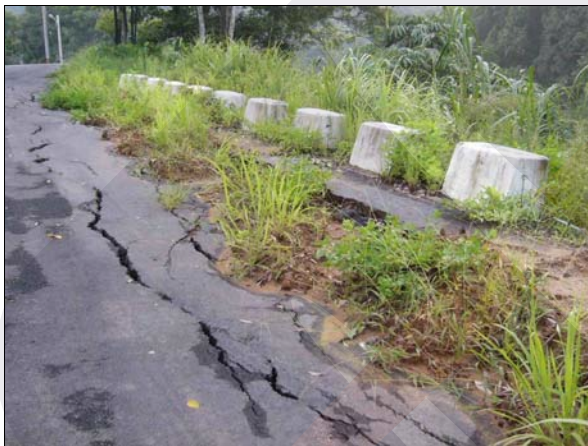
照片 2 牆面外傾、開裂