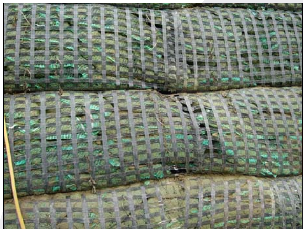
照片 6 加勁格網橫向肋條斷裂